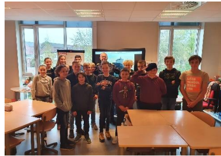
Foto van Johan de Wit schip